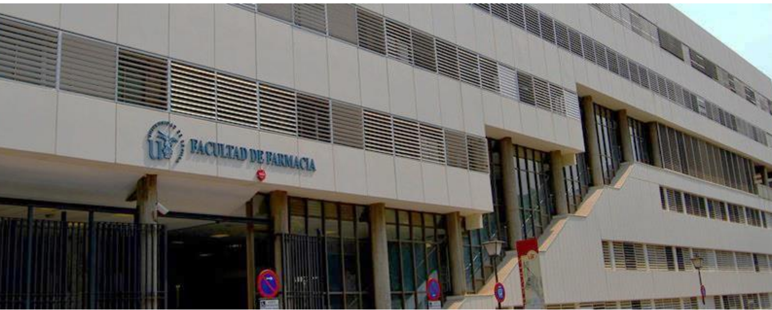
Sociedad Española de Farmacología